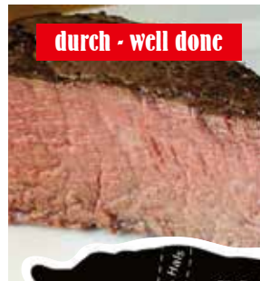
durch - well done

Zu allen Steaks servieren wir Ihnen einen Salatteller, Knoblauchbrot und wahlweise Krokette, Pommes Frites, Kartoffelecken, Bratkartoffeln oder Ofenkartoffel mit Sour Cream. 2 herzhafteste Steak-Saucen inklusive und Kräuterbutter auf Wunsch. Wir servieren grundsätzlich zarte und saftige Steaks allerbesten Qualität – auf unserem Lavastein-Grill nach Ihrem Wunsch gegrillt: englisch – medium – durch