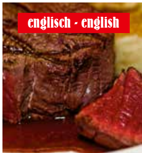
englisch - english